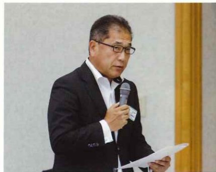
会計監査報告 静岡県本部 妹背会計幹事