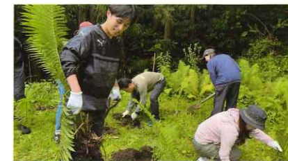
富士市・富士川支部(2024.6.16) こぶしの会と連携 こぶしの里/こごみの移植、下草刈り