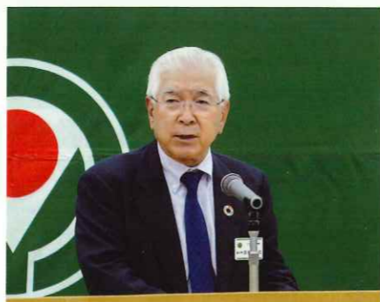
閉会あいさつ 静岡県本部 御室副代表