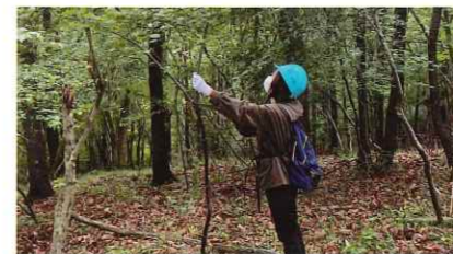
伊豆の国市・修善寺支部(2024.6.1) 森林づくり伊豆の会と連携 猪垣の森/間伐、除伐