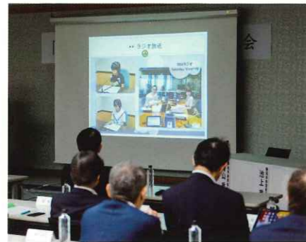
スライドによる事業報告