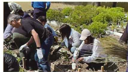
島田市・島田支部(2024.5.11) O2夢炭会と連携 島田市野田/フジバカマの植栽