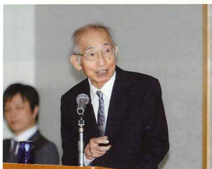
中井氏による講演