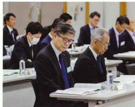
多くの皆さまにご出席いただきました