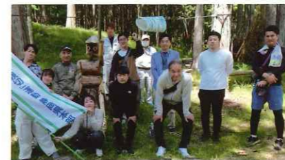
裾野市・裾野支部(2024.5.18) NPO法人里山会公文名ファイブと連携 仙郷の森/植樹、下草刈り