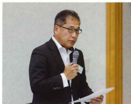
会計監査報告 静岡県本部 妹背会計幹事