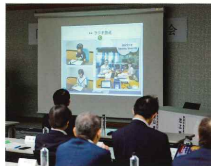
スライドによる事業報告