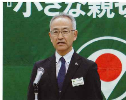
来賓あいさつ 静岡県健康福祉部 青山部長