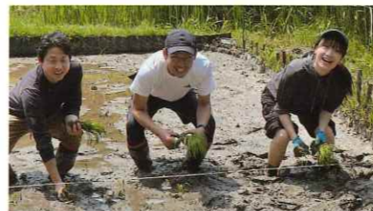
浜松市中央区・山下支部(2024.5.25) 椎ノ木谷保全の会と連携 椎ノ木谷緑地/田植え、下草刈り