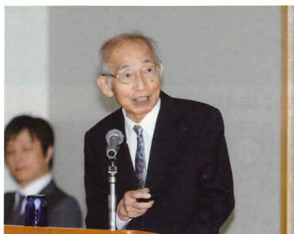
中井氏による講演