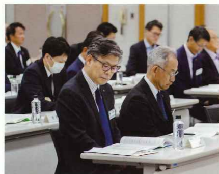
多くの皆さまにご出席いただきました