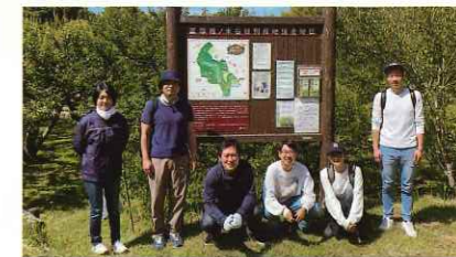
浜松市中央区・住吉支部(2024.5.18) 奥の平ホルタルの里と連携 奥の平/植樹、下草刈り